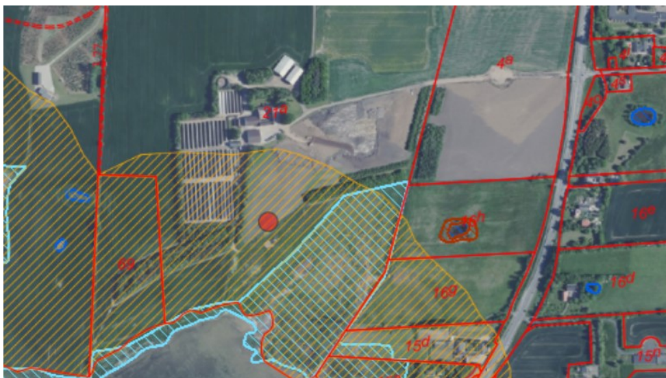
Figur 1. Ortofoto 2020. Det orange skraverede område markerer det strandbeskyttede areal. De røde streger markerer de vejledende matrikelskel, den blå skravering er beskyttet natur og ejendommen er markeret med rød prik.

Af ansøgningen fremgår, at der tidligere er meddelt tilladelse til at regulere terrænet udenfor strandbeskyttelseslinjen. Der ønskes nu reguleret yderligere i terrænet, også indenfor strandbeskyttelseslinjen, hvorfor kommunen har henvist til Kystdirektoratet.